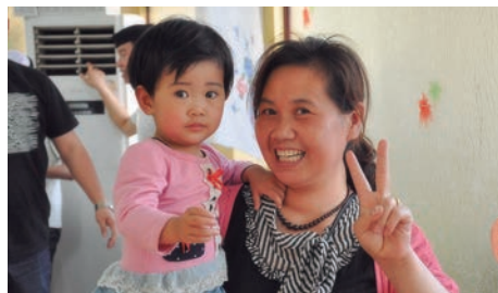
Mãe e filha da etnia chinesa Han

O governo continua vendo os cristãos como traidores e espiões, por isso eles precisam praticar sua fé em silêncio. Ore para que o Senhor continue fortalecendo a igreja no país mesmo em circunstâncias tão complicadas.