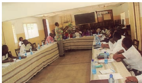
Líderes são preparados para lidar com a perseguição no Mali

Há anos que os cristãos vêm sendo atacados e os grupos rebeldes têm atuado com grande violência, aumentando o número de sequestros e assassinatos. Ore por eles e interceda pela provisão divina.