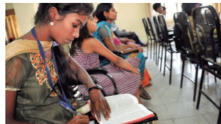
Participantes de treinamento bíblico na Índia