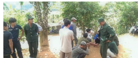
Cristãos vietnamitas são impedidos de adorar a Deus