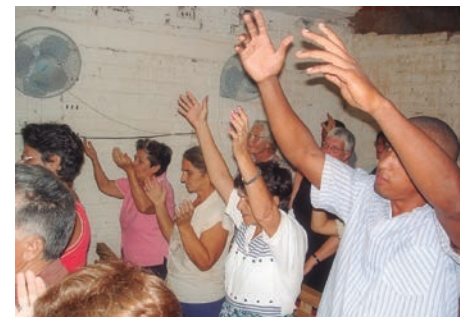
A igreja em Cuba ora pela provisão divina

pelos projetos discutidos e para que sejam realizados com estratégia.