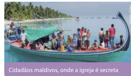
Cidadãos maldivos, onde a igreja é secreta

O país, regido pela sharia (lei islâmica), tem regras rígidas contra o cristianismo, e os cristãos precisam de muita sabedoria para lidar com as autoridades e continuar com a evangelização. Ore por eles.